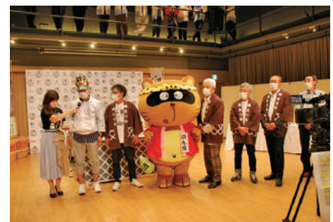
(公社) 東広島市観光協会