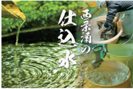
西条酒の仕込み水