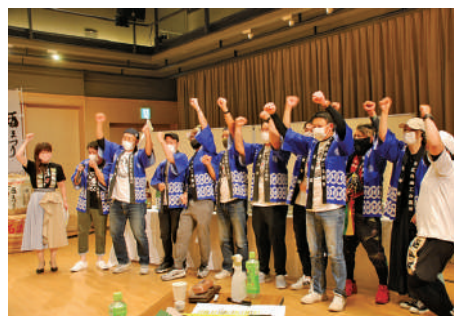
東広島商工会議所青年部 (YEG)