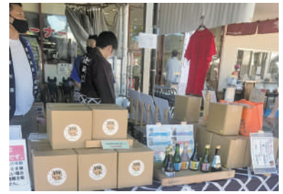
道の駅湖畔の里福富での出店