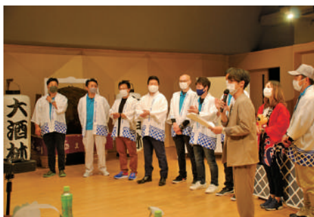
(一社) 東広島青年会議所 (JC)