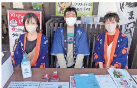
わくわくビン GO ラリー