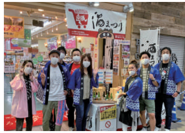
ひろしま夢ぼらざでの出店