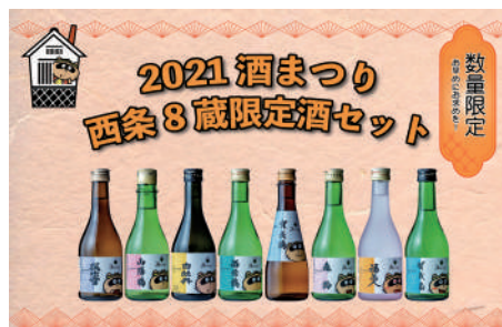
西条8蔵限定酒セット