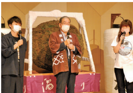
高垣東広島市長へのインタビュー