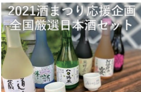
全国厳選日本酒セット