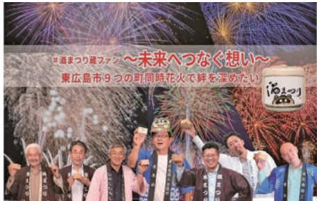
花火のクラウドファンディング