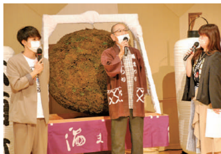
蔵田大会会長へのインタビュー