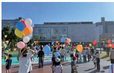
アッ！と驚く ART イベント