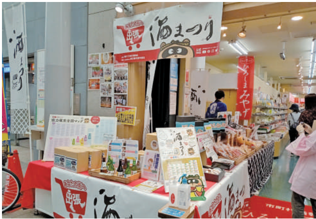
出張！酒まつりの出店模様（ひろしま夢ぼらざ）

本年は、コロナ禍の影響で全体的にすべての内容が後手後手になってしまい、従来の酒まつりとは全く違う形の酒まつりになりました。昨年と同様に酒ひろば会場は中止となりましたが、酒ひろば部会としては、例年通り全国の蔵元からお酒を集め、初めての企画である「出張！酒まつり」とオンラインショップにより販売する事になりました。