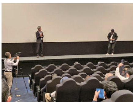
試写会で舞台挨拶する油谷監督(右)