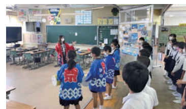
西条小学校 5年4組の皆さん