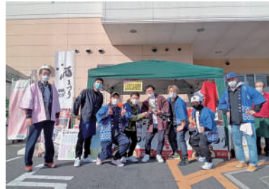
ショージ・バイパス店での出店