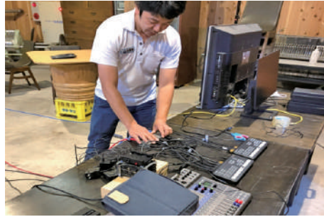
オンライン乾杯イベントのスタジオ準備