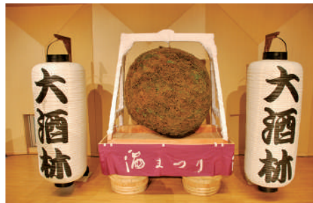
杉玉と大酒林の提灯

杉玉作製は、伝統および技術を継承するということで、今年も北谷大工に教わりながら、酒造協会・実行委員会のメンバーが主体で9月20日～22日に行いました。本年は緊急事態宣言下であり、学生ボランティアの方にはご遠慮いただきました。本来なら5日間かかるのですが、応援も含め人数をかけて作業を行い、3日で完成することができました。杉玉は最終的には市役所正面玄関前に陳列することになりましたが、当初は展示場所がなかなか決まらず、また決まったあとも、設置先の要望による関連業務が多く、色々大変でした。