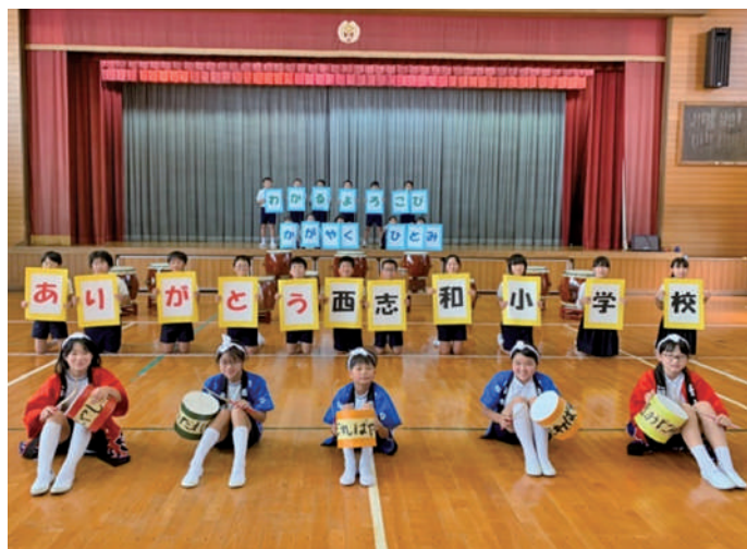
西志和小学校 6年生の皆さん