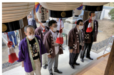
松尾神社への参拝