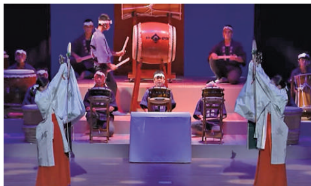
組曲『西條』(西条中学校)

最後になりますが、多くの方々に支えられて無事に成し遂げること ことができました。撮影した動画を編集し、YouTubeにて配信して くださったオンライン部会の皆さま、運営に携わってくださった学 生ボランティアの方々、部会員の皆さま、無理難題を聞いていただ いた東広島芸術文化ホール「くらら」の皆さま、多くの皆さまに感 謝申し上げます。YouTube 配信では、コロナ禍で見ることのでき なかった方や遠方の方もみることが可能になり、多くの方に見てい ただき喜んでいただきました。本当にありがとうございました。