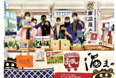
広島国際空港での出店