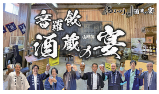
オンライン乾杯イベント「酒蔵の宴」

例年、各酒蔵が行っていた酒蔵イベントは新型コロナウイルス感染症拡大防止の観点から本年も取り止めとなりました。そのため、酒まつり公式ホームページに酒の命と言われる西条酒の仕込み水の解説を掲載し、さらに各酒蔵から1名が参加し、オンライン乾杯イベント「酒蔵の宴」をYouTubeにより配信いたしました。